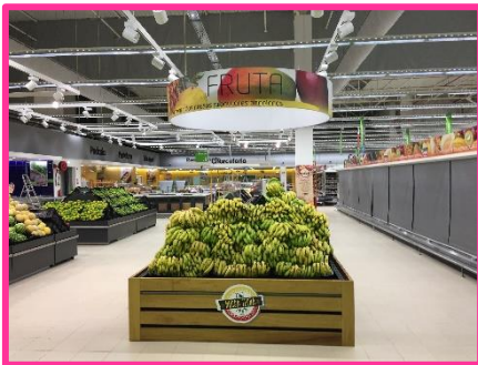
Candeeiro hipermercado Kero Lubango, criação e produção Huiladesign

As suas ideias e know how combinados, permitem-nos criar peças tridimensionais exclusivas, únicas, luminosas ou não, para que a sua acção seja um sucesso.