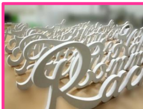
corte cnc pvc