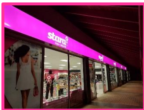
reclamo luminoso, led